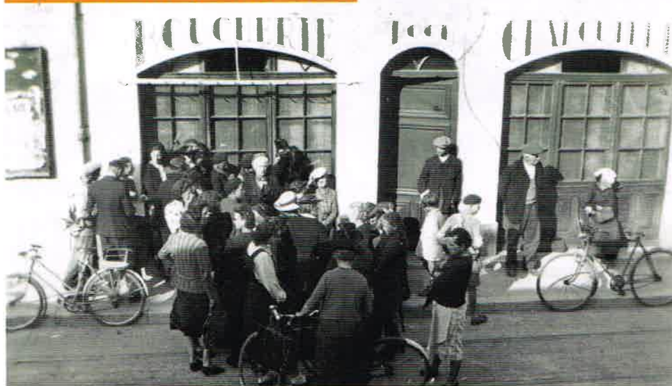
Dans la grand'rue, la boucherie Roch à l'heure des tickets de rationnement (octobre 1943).

En partenariat avec la mairie et à sa demande, nous nous efforcerons d'organiser régulièrement des expositions et animations mettant en valeur le patrimoine mémoriel de notre cité. Cette année, outre une présentation de notre projet et de nos premières acquisitions, nous ferons une place particulière à la vie à Ferney entre 1939 et 1945. Cette exposition s'ouvrira d'ailleurs