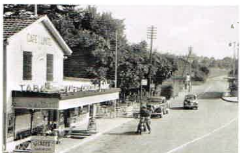
Le café Blandin a également disparu lors de l'agrandissement de l'aéroport.