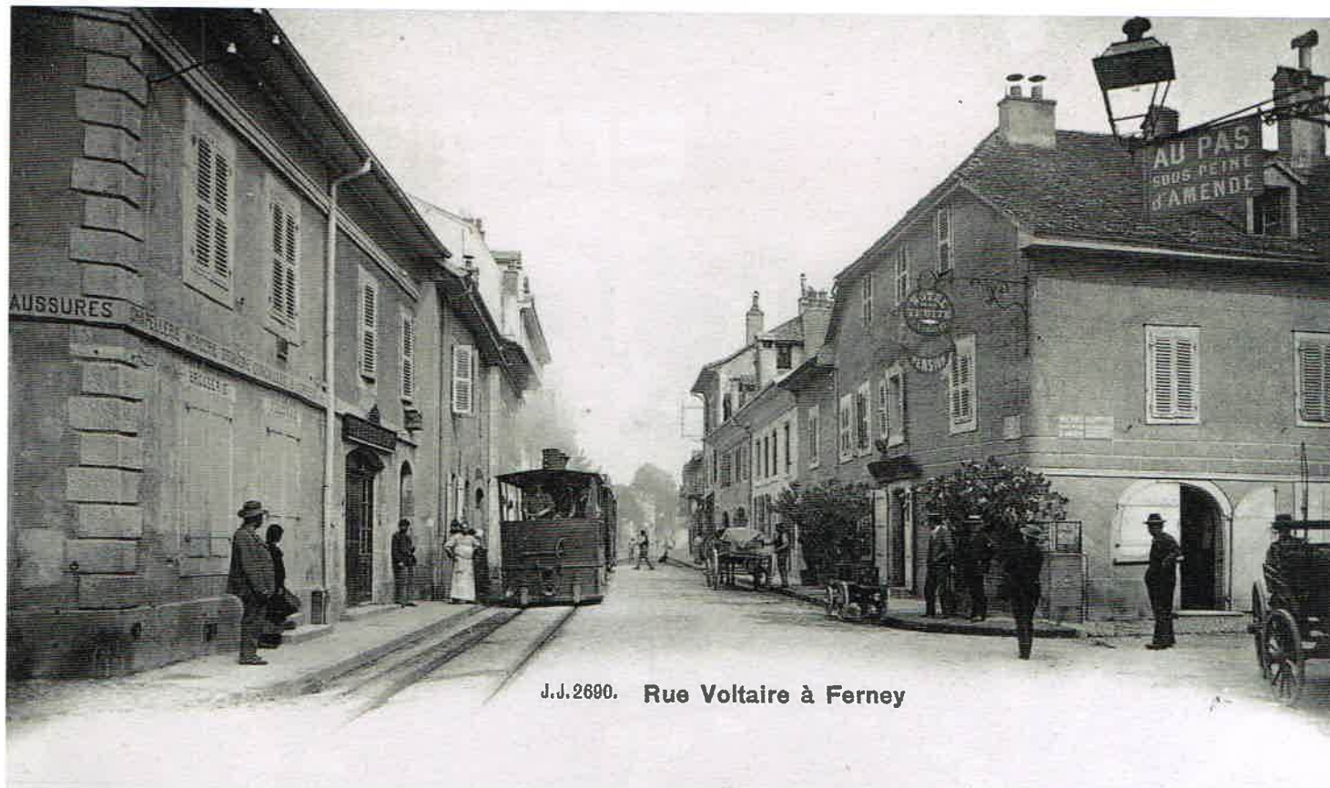
J.J.2690. Rue Voltaire à Ferney

Comment garder Ferney en mémoire ? Chaque famille conserve des photos, des documents, des secrets. Quelle part de nous-mêmes accepterons-nous de partager pour que chaque Ferneysien puisse se remémorer ou découvrir l'âme si particulière et tellement émouvante que nos familles, notre village ont réussi à entretenir malgré l'érosion du temps, l'explosion démographique et la banalisation du quotidien ?