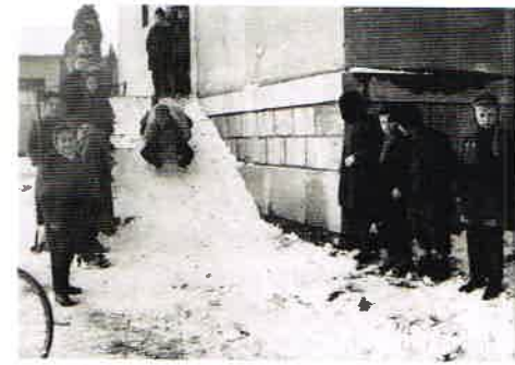
... et dans les années cinquante.

Pour une précédente exposition réalisée en 1999, plusieurs familles ferneysiennes avaient confié à la mairie des photographies, qui avaient pu être scannées et exposées. Hélas, la technique de l'époque ne permettait pas une numérisation de qualité. Ce travail doit être repris et étendu. Il nous est désormais possible, si les personnes le souhaitent, d'effectuer cette numérisation à leur domicile grâce à un matériel léger et de qualité.