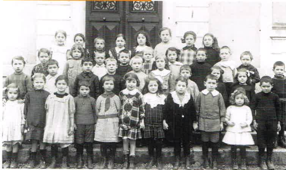
L'école de Ferney dans les années vingt...

Pour une précédente exposition réalisée en 1999, plusieurs familles ferneysiennes avaient confié à la mairie des photographies, qui avaient pu être scannées et exposées. Hélas, la technique de l'époque ne permettait pas une numérisation de qualité. Ce travail doit être repris et étendu. Il nous est désormais possible, si les personnes le souhaitent, d'effectuer cette numérisation à leur domicile grâce à un matériel léger et de qualité.