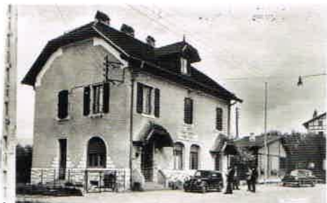
L'ancienne douane de la Limite, détruite en 1957.