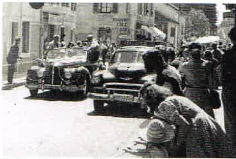
Le Tour de France à Ferney en 1953.