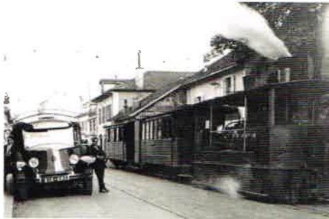
Ligne Ferney-Gex : dernier «tacot», premier bus.